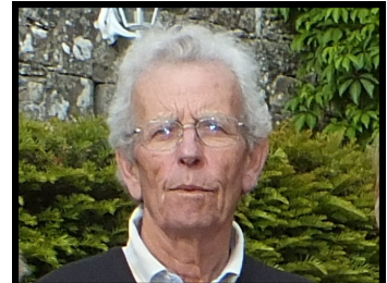
Emmanuel du Jeu Informatique Communication