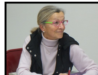
Sonia Turbot Commission animation