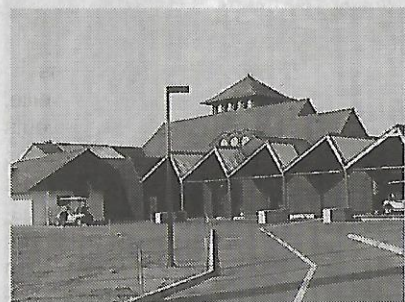
Façade avant du nouveau club house du golf de Baden-Vannes Agglo.

Depuis plusieurs mois, le golf, propriété de Vannes Agglo, était en travaux. Le bâtiment et l'accueil date de 1989, il n'avait subi qu'une petite rénovation, il y a dix ans.